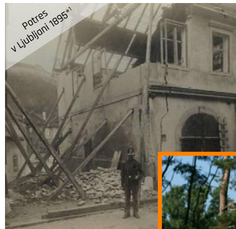
Potres v Ljubljani 1895*1