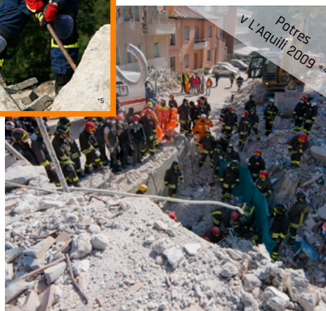
Potres v L'Aquila 2009*4