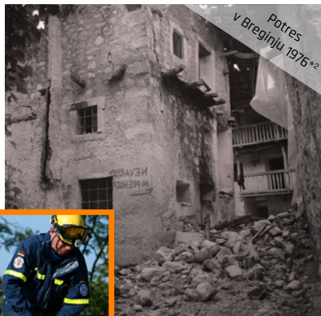
Potres v Breginju 1976*2