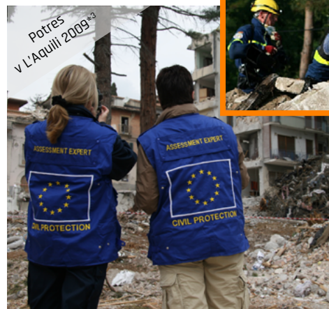
Potres v L'Aquila 2009*3